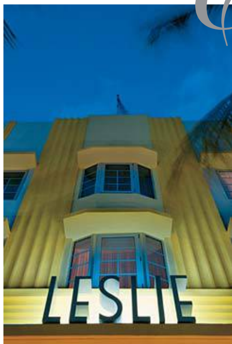
Leslie, una joya Art Decó , en South Beach .

Este no es un año cualquiera para Miami: 2015 es el aniversario número 100 de una ciudad que sigue marcando el pulso de las tendencias mundiales. Durante marzo por ejemplo, South Beach celebró con unas simbólicas 100 horas de distintos eventos, que se coronaron con el Miami Beach Centennial Concert . Pero en la ciudad donde el mar, el sol y el shopping son protagonistas, afortunadamente el arte también lo es, y cada vez más. El Art Basel —con sede original en Suiza, pero que plantó bandera en Miami desde 2002— se ha convertido en la feria de arte más importante de Estados Unidos, transformando el perfil de la ciudad. Se trata de un verdadero fenómeno artístico que invade Miami con shows , ferias y exposiciones paralelas donde se puede ver arte en todas sus expresiones, a lo largo de una semana, durante diciembre de cada año. Perfecta combinación entre arte y diversión que da como resultado un éxito turístico que atrae a más visitantes en cada nueva edición —la última recibió a más de 70.000 personas de todo el mundo—, además de contar con la destacada participación de galeristas, coleccionistas y artistas internacionales, siempre con foco en arte moderno y contemporáneo.