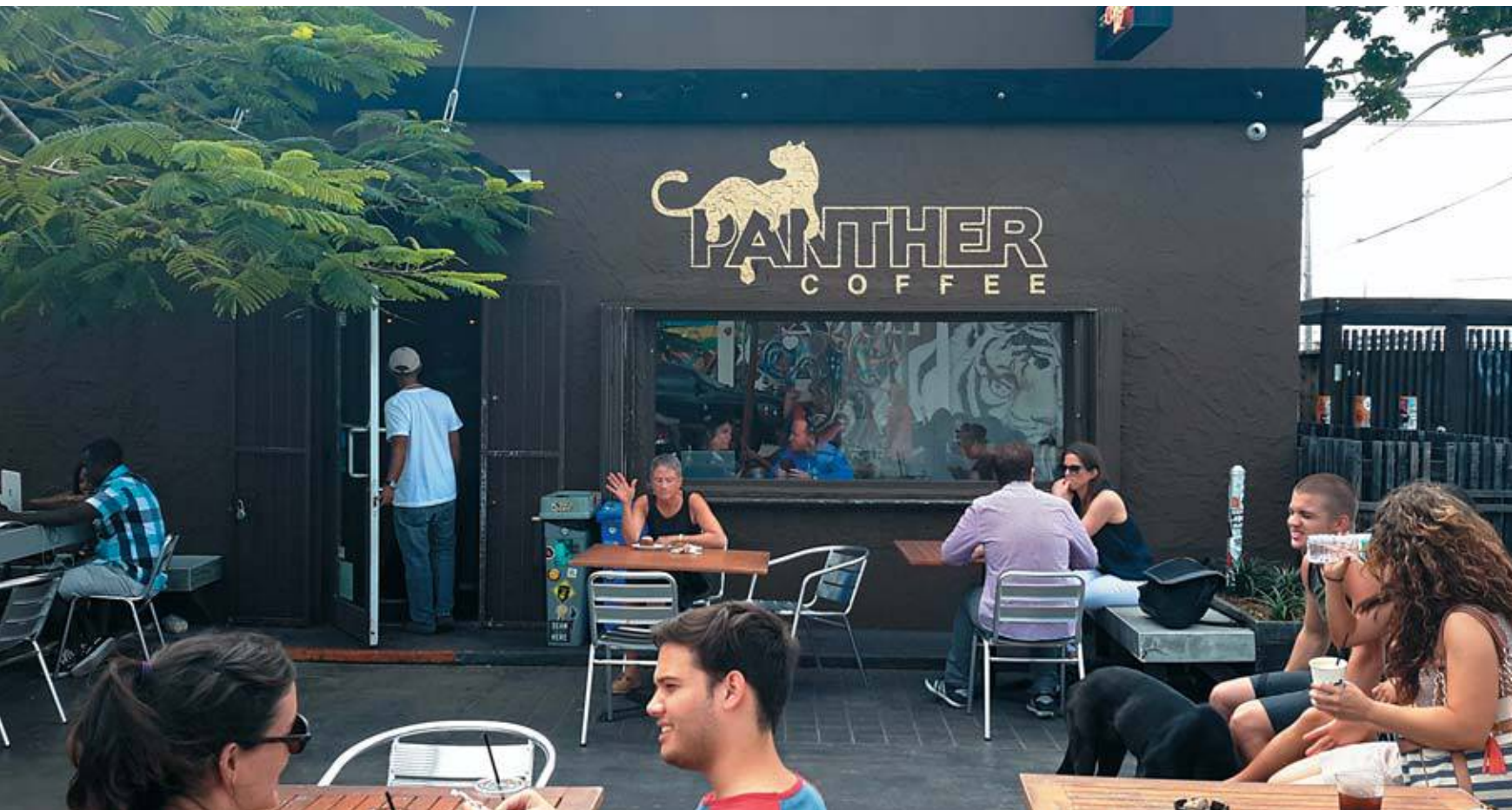
Detener la caminata y parar en Panther por un café, una cita obligada.