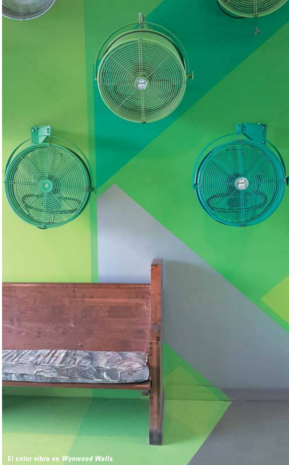
El color vibra en Wynwood Walls .

El graffiti del artista brasileño Kobra.